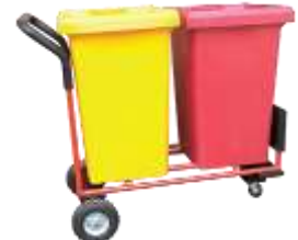
CARRO R-240 Lts.