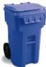
MSD 260 Lts.