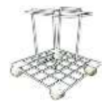
SUJE-30-C PARA PC-30