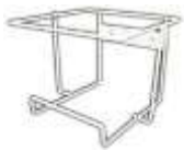
SUJE-2-C, PARA PC-2