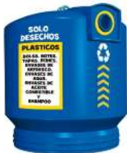
IGLU 3400 Lts.