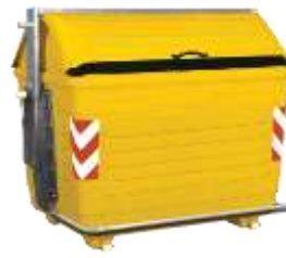
CONT. METALICO 2600 Lts.