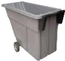
VOLQUETE 500/750/1000 Lts.