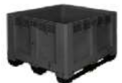
BIN ALEMAN MA-760 630 Lts.