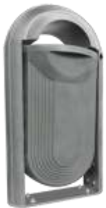
STRAD 80 Lts.