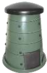
COMPOSTERO 450 Lts.