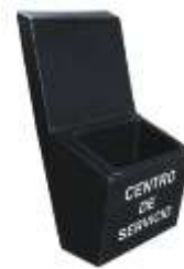
CENTRO DE SERVICIO