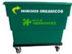
CARGACARRO 450, 900 Y 1100 Lts.