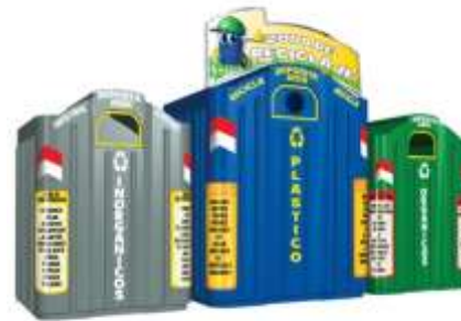
IGLUS RECICLA 2200 Y 3200 Lts.