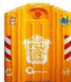
VANGUARD 3200 / 2200