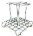
SUJE-13-C PARA PC-13