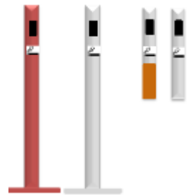
LIMA-30 Lts. BARCELONA ARCO 80 Lts. BARCELONA RECICLA 160 Lts. BARCELONA 80 Lts. CEN-M CENICERO