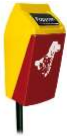
POPYCAN 50 Lts.

Fabricamos gran variedad de señalamientos y accesorios viales, así como contenedores para residuos, papeleras, tarimas, cajas plásticas de gran capacidad y otros productos para hospitales, hoteles, fábricas, edificios, centros comerciales, estacionamientos, fraccionamientos, parques y áreas públicas en general. Consulte la ficha técnica de nuestros productos en nuestra página o comuníquese con nosotros.