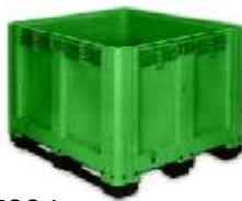
BIN ALEMAN MA-825 700 Lts.