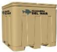
ISOTERMICO 600 Y 835 Lts.