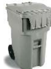
MSD 360 Lts.