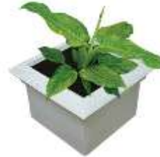
CUADRADA DE JARDIN