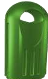
CALITAT 120 Lts.