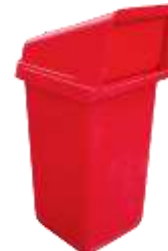
DIAMANTE 150 Lts.