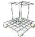
SUJE-8, PARA PC-8