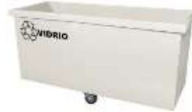
CARRMOVIL 360 y 390 Lts.