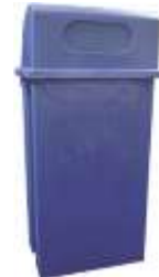
MADRID 120 Lts.