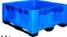
BIN ALEMAN MA-580 460 Lts.