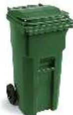
MSD 120 Lts.