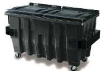
MGB 1700 Lts.