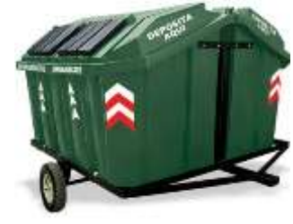
REMOLQUE VIC-2000, 4000 Lts.