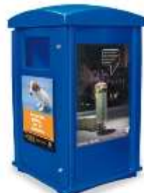
PUBLICITARIO 320 Lts.